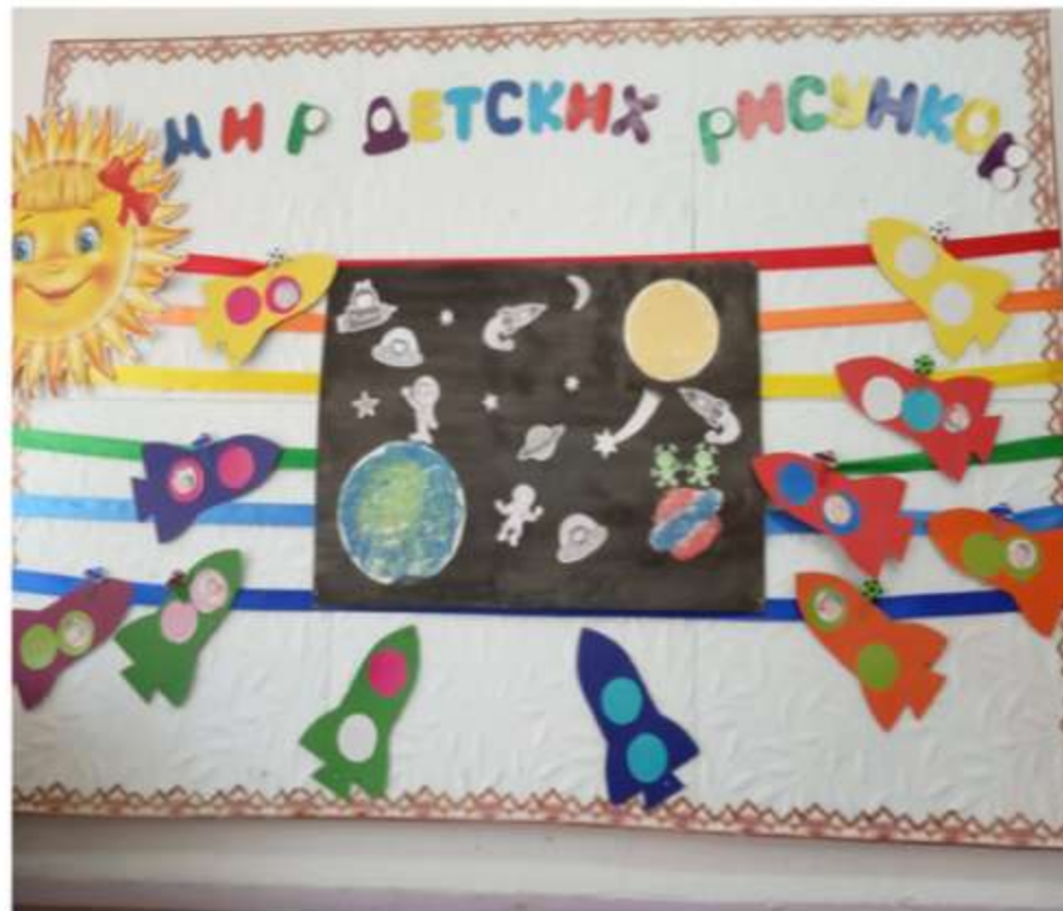
«Полёт к другим планетам»