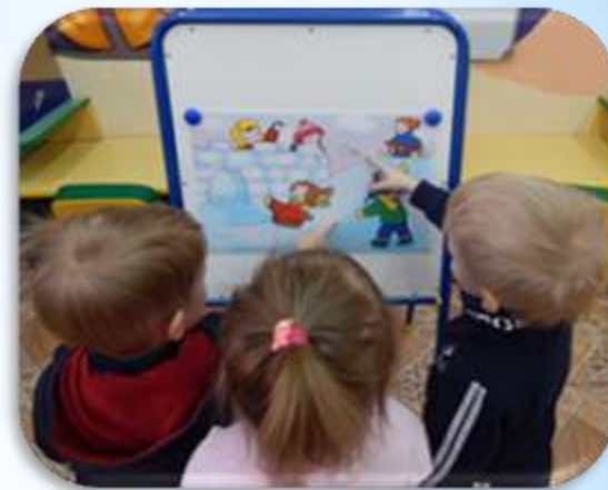
«Рассматривание картины «Зимние забавы»»